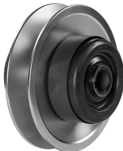
TABELLA DIMENSIONALE (mm) - DIMENSIONS TABLE - GRÖSSENTABELLE